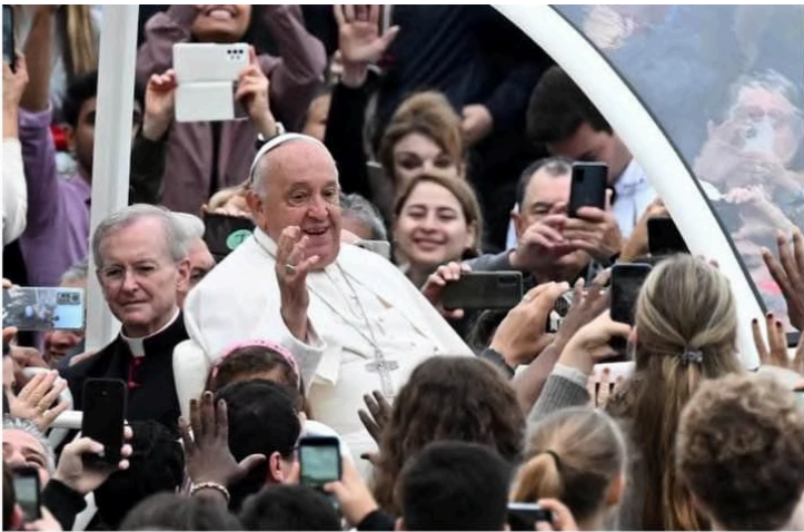
El papa Francisco, el miércoles en la plaza de San Pedro del Vaticano.

Estoy escribiendo esta nota el 24 de octubre, día que celebramos el 10° aniversario del modelo Sinapsis. El hito formal lo marca la constitución legal de impacto, desarrollo rural sustentable como asociación civil; iniciativa que se conoce como “impacto café”. Coincide la efeméride con la publicación de la 4ª encíclica de Papa Francisco con un mensaje que comulga, valga la redundancia, con nuestra visión: “... fortalezcamos la capacidad de amar y servir y aprendamos a caminar juntos hacia un mundo solidario y fraterno”.